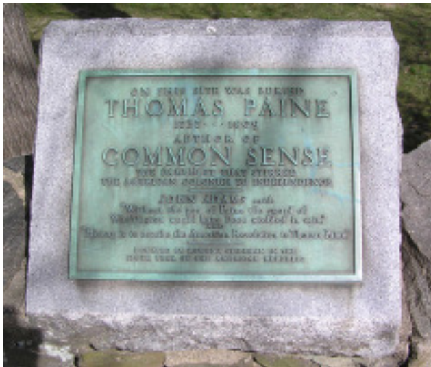
ජේන්ගේ සොහොන්ගැබ නිව් රොෂෙල්, නිව් යෝර්ක්

ඔහුගේ වෘත්තීය ජීවිතය අසාර්ථක එකක් ලෙස දැකිය හැකි ය. බ්‍රිතාන්‍ය නාවුක හමුදාව සඳහා කාලතුවක්කු තැනීම මගින් චෝකර්ස් සමාගම පොහොසත් විය. වික්ටරි නම් වූ නෙල්සන්ගේ පතාක නෞකාවේ තිබූ කාල තුවක්කුවලින් අසුවක් ම චෝකර්ස් හි තන ලද ඒවා විය. පිට්ටනි කරා ඇවිද